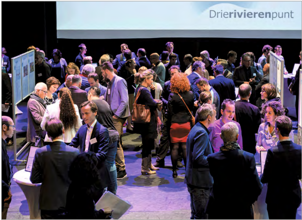
Eindconferentie Atelier Drechtsteden