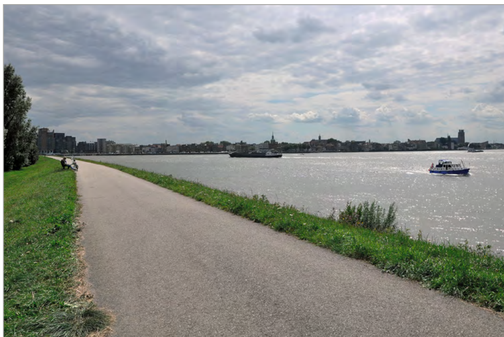
Drierivierenpunt vanuit Papendrecht met zicht op Dordrecht

Op de Laak: ‘Nog niet helemaal. Dat heeft, denk ik, verschillende oorzaken. De resultaten van het Atelier werden gekoppeld aan andere visies en zijn gezamenlijk aan het bestuur voorgelegd. Het verwerken daarvan kost tijd. Om de grens-ontkennende adviezen