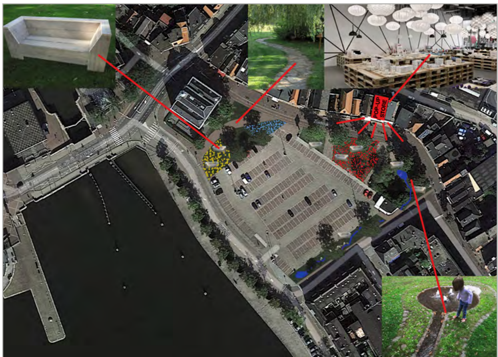
Potenties voor het gebied