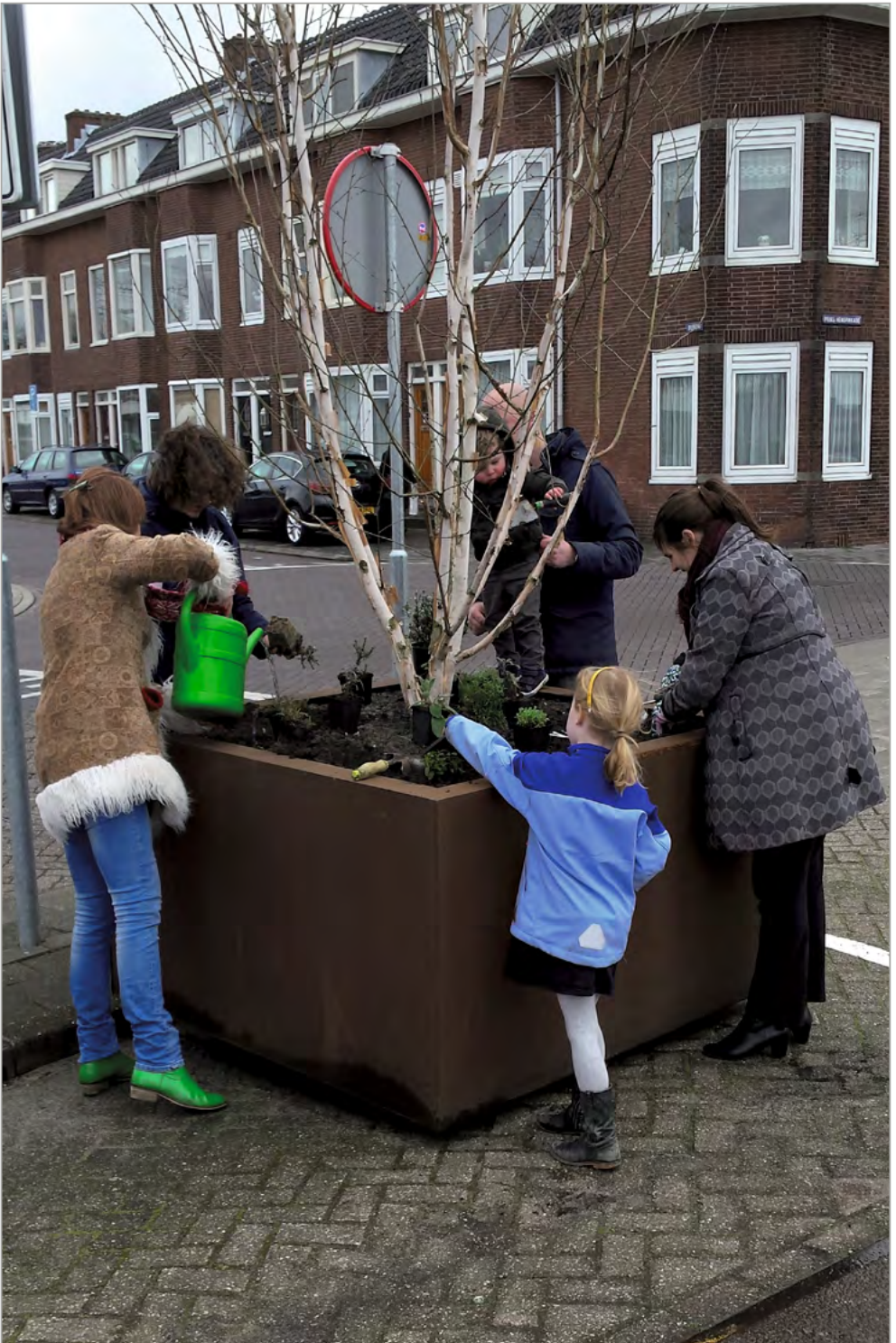
Samen investeren in een leefbare samenleving