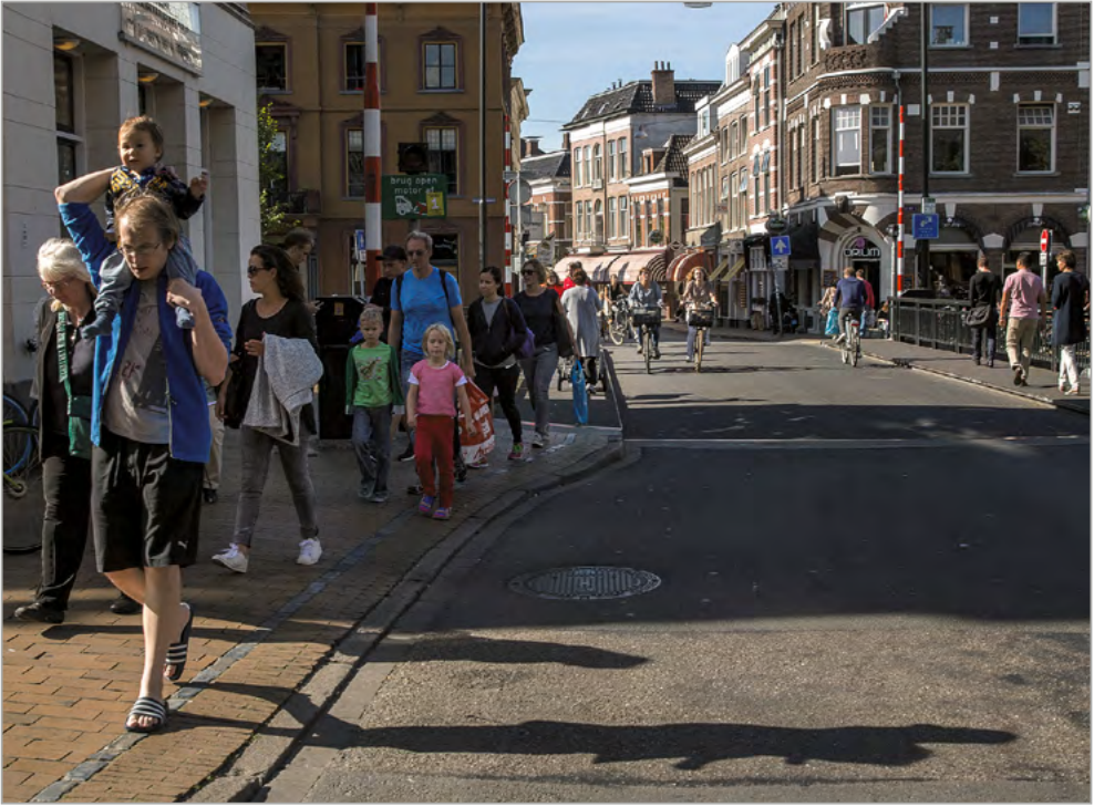
Fietsen en wandelen in Groningen